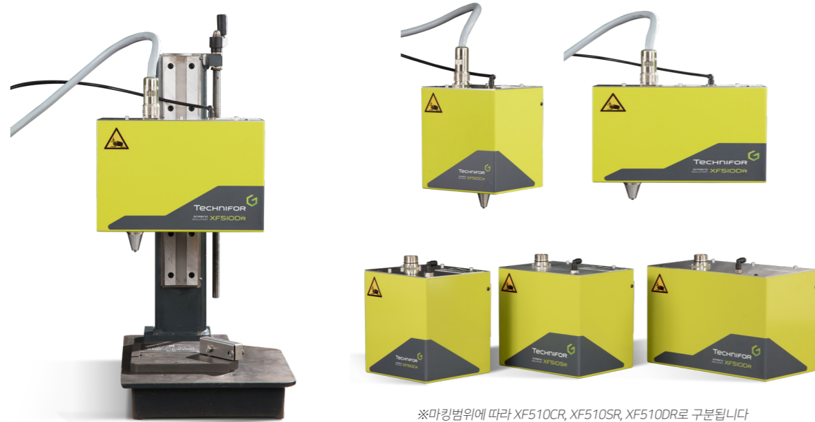
※마킹범위에 따라 XF510CR, XF510SR, XF510DR로 구분됩니다

스크라이빙마킹기는 굵어서 마킹을 하는 타입으로 마킹퀄리티가 매우 높습니다.